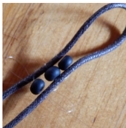
Bild 4: Für den Verschluss die Enden des ersten Lederbandes zu einem dicken Knoten verbinden. Beim zweiten Lederband wird mit dem einen Ende eine Schlaufe geformt und das andere Ende so darum gewickelt und geknotet, dass eine Öffnung entsteht durch den der Knoten des ersten Lederbandes geführt werden kann. Knoten und Schlaufe am besten mit Sekundenkleber fixieren. Beide Lederbänder zum Schluss so ineinander zusammenführen, dass ein Samariterknoten entsteht. Um das Handgelenk legen und mit dem Knotenverschluss verschließen.

Bild 2 und 3: Die Kinder legen dazu eine erste Perle zwischen die Bänder. Und fädeln einen Nylonfaden so hindurch, dass er mit der Perle auf den Schnüren liegt. Die Perle leicht nach unten drücken und beide Enden des Nylonfadens unten von links nach rechts und umgekehrt zurückfädeln. Mit einer weiteren Perle fortfahren.