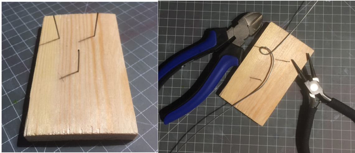
Foto-Bastelanleitung Kreuz aus Silberdraht

In kleine Brettchen werden vorab 3 kopflose Nagelstifte fest eingeschlagen wie auf dem Foto links. Der Silberdraht wird nun in Schlaufen um diese Nägel geschlungen.