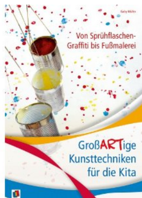
Gaby Müller GroßARTige Kunsttechniken für die Kita Von Sprühflaschen-Graffiti bis Fußmalerei Verlag an der Ruhr

Die Bibel beim Puzzeln erleben – das bietet dieses Puzzlebuch mit 10 Geschichten wie zum Beispiel „Der gute Hirte“ und „Die Weihnachtsnacht“. Neben jeder Geschichte befindet sich ein sechsteiliges Puzzle, das schon den Kleinen einen spielerischen und ungezwungenen Zugang zu Gottes Wort ermöglicht. Einfache Texte, niedliche, farbenfrohe Zeichnungen und robustes Material machen dieses ungewöhnliche Bilderbuch zu einer guten Ergänzung für die Bücherkiste im Gruppenraum.