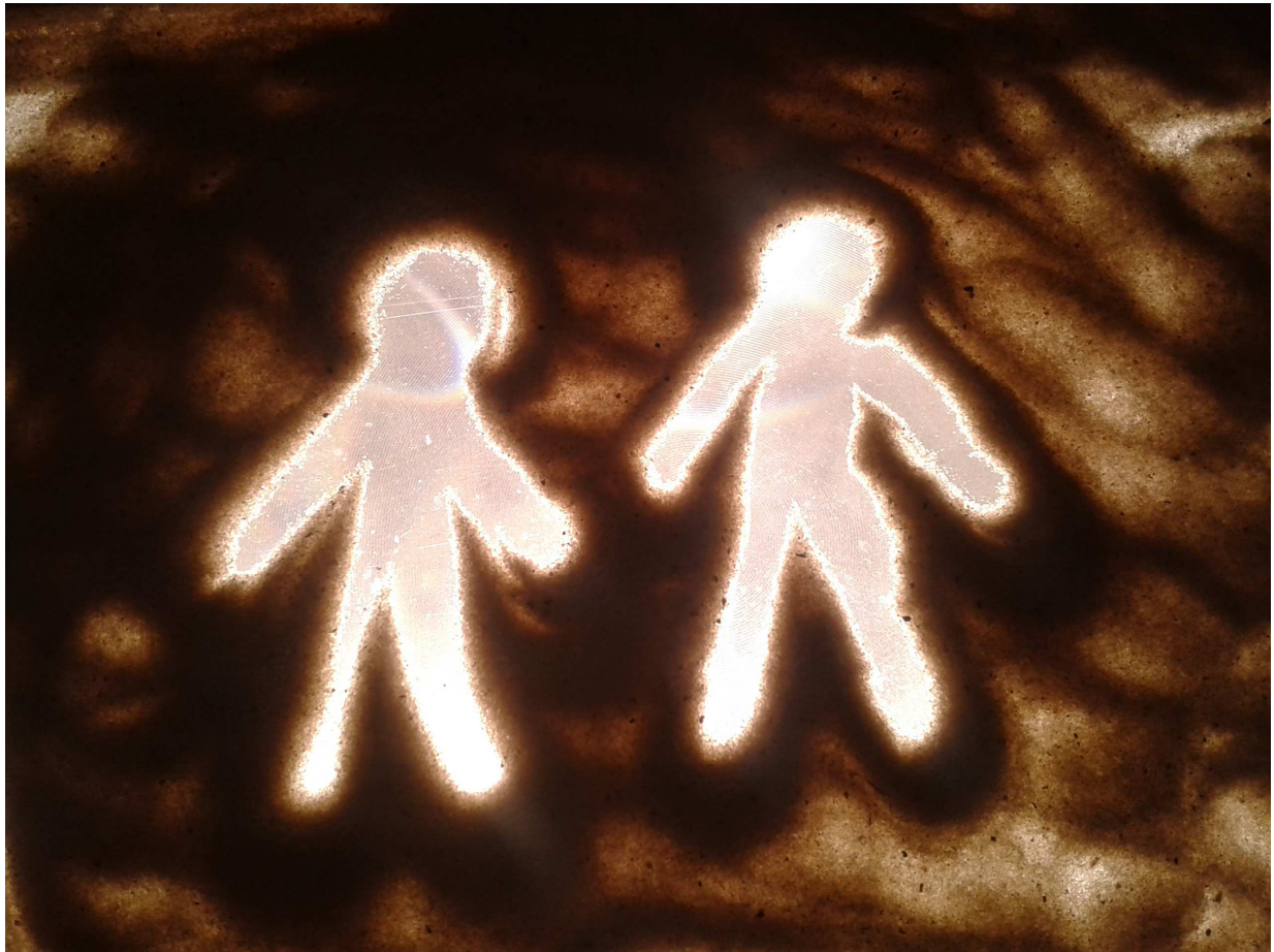
Boas spricht mit dem Erntehelfer