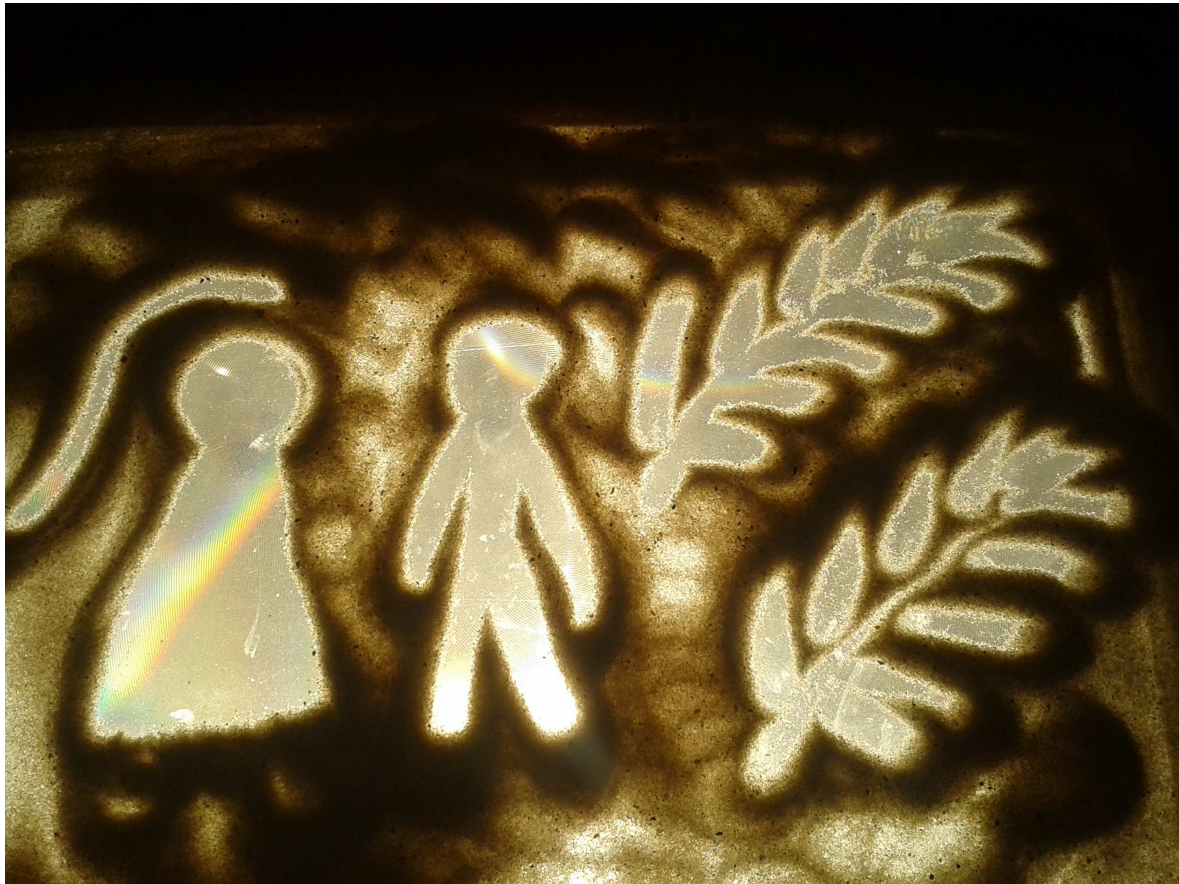
Boas spricht auf dem Feld mit Ruth